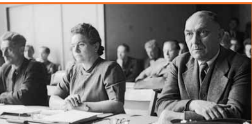
Bei der konstituierenden Sitzung des Parlamentarischen Rates

Die dazu erforderliche grundlegende Reform des Bürgerlichen Gesetzbuches (BGB) machte den Kampf für die Umsetzung des Art. 3 Abs. 2 lang, mühsam und außerordentlich kräftezehrend.