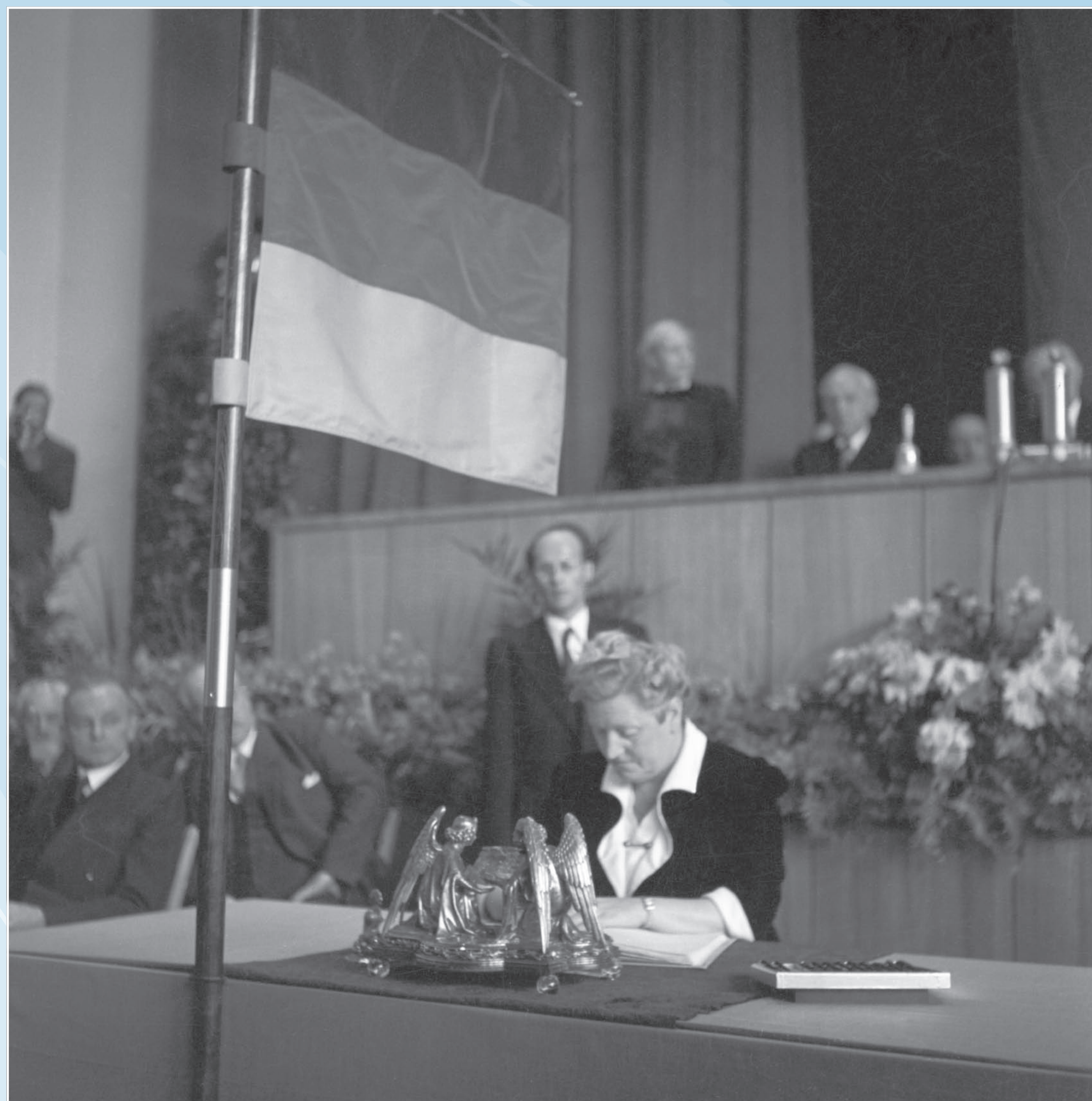
23. Mai 1949 – Elisabeth Selbert unterzeichnet das Grundgesetz

Sie hatte zuerst Frieda Nadig (SPD) zu überzeugen, die aufgrund ihrer Kenntnisse des Familienrechts ein gesetzliches Chaos befürchtete. Helene Weber und Helene Wessel, die beiden anderen Frauen im Parlamentarischen Rat und Mitglieder im Grundsatzausschuss, favorisierten zuerst eine Formulierung, die die „Eigenart“ des Weiblichen berücksichtige. Die Mehrheit der Verfassungsväter wollte die Formulierung der Weimarer Verfassung übernehmen: „Männer und Frauen haben dieselben staatsbürgerlichen Rechte und Pflichten“.